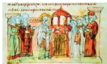
Висвячення свт. Іларіона на митрополита. Мініатюра у Радзивілівському літописі XV ст.

Відомості про митрополита Іларіона, що дійшли до нас, дуже бідні. Літопис каже, що спочатку Іларіон був