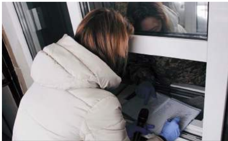
На контрольно-пропускному пункті

Окрім начальника закладу нас супроводжували також ще один працівник і працівниця центру.