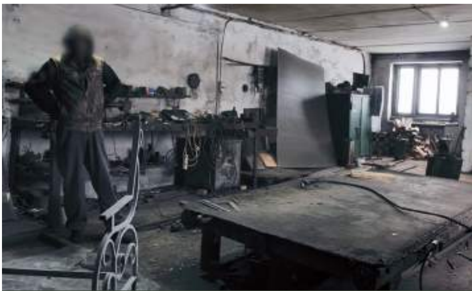
На контрольно-пропускному пункті

Засуджені до обмеження волі потрапляють сюди на пом'якшені умови відбування покарання з колоній. Серед них є вбивці, розбійники, крадії, гвалтівники. Наприклад, два роки з десятирічного терміну покарання за хорошу поведінку злочинець може відбувати тут і виходити у відпустку за периметр у вихідні дні.