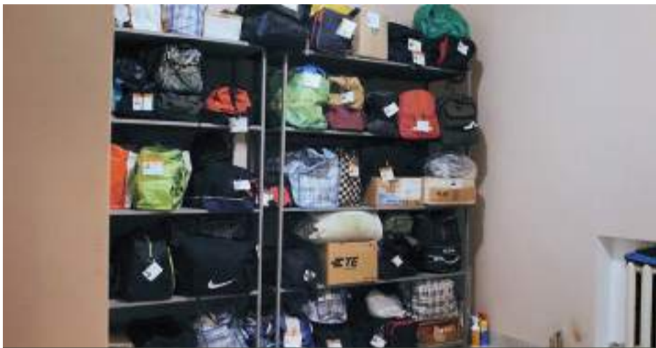
Кімната для зберігання речей