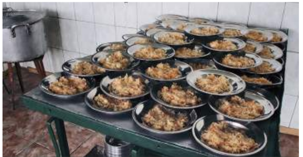
Каша, капуста і ковбасна підлива

У другому гуртожитку живуть засуджені до позбавлення волі. Це сектор мінімального рівня безпеки, тому він локалізований огорожено.