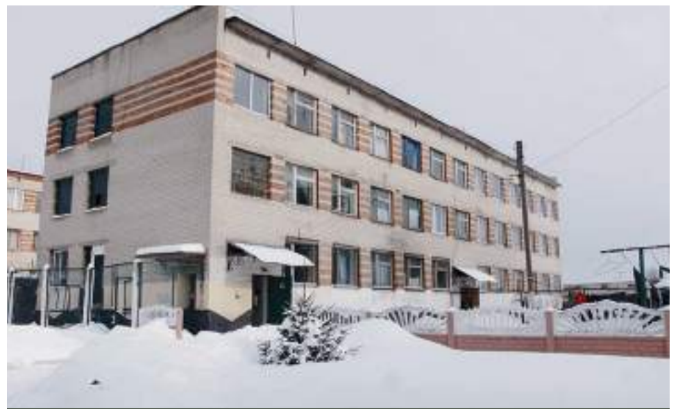
Гуртожиток для засуджених