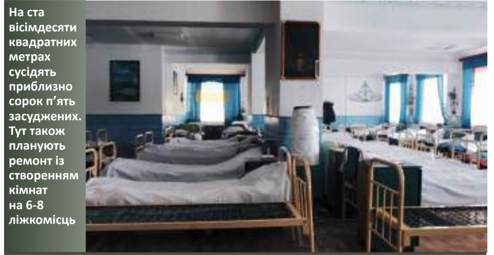
На ста вісімдесяти квадратних метрах сусідять приблизно сорок п'ять засуджених. Тут також планують ремонт із створенням кімнат на 6-8 ліжокмісць